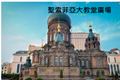
聖索菲亞大教堂廣場