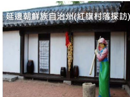
延邊朝鮮族自治州(紅旗村落探訪)