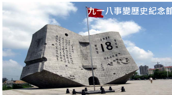
九一八事變歷史紀念館