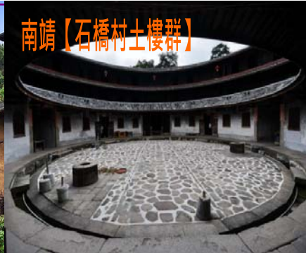
南靖【石橋村土樓群】