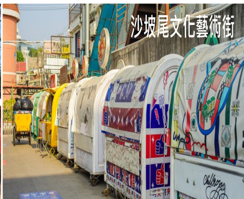
沙坡尾文化藝術街