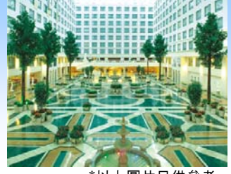
*以上圖片只供參考