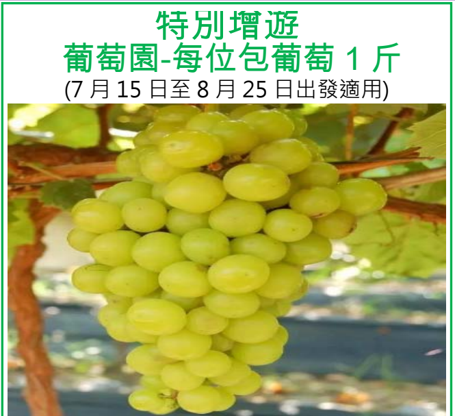
特別增遊 葡萄園-每位包葡萄1斤 (7月15日至8月25日出發適用)