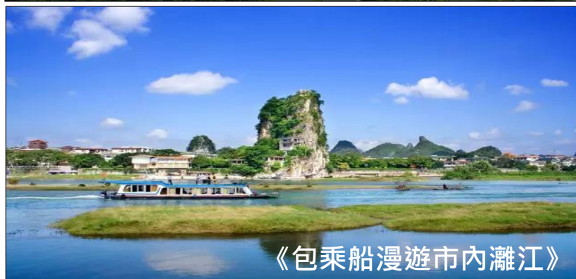
《包乘船漫遊市內灕江》