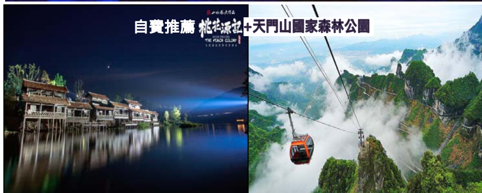
自費推薦 桃花源記 + 天門山國家森林公園