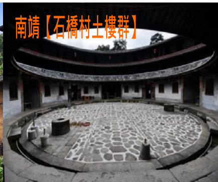
南靖【石橋村土樓群】