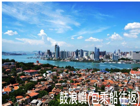
鼓浪嶼(包乘船往返)