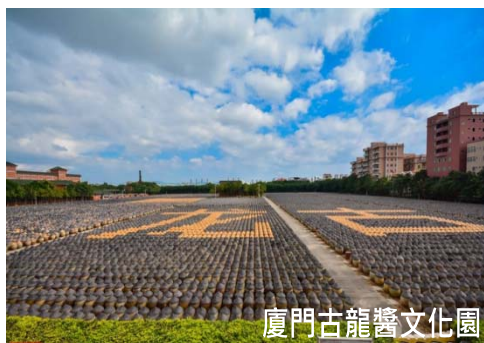
廈門古龍醬文化園