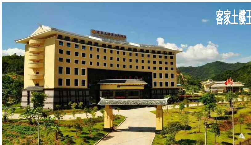
客家土樓王子大酒店及客房