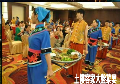
土樓客家大盤菜宴