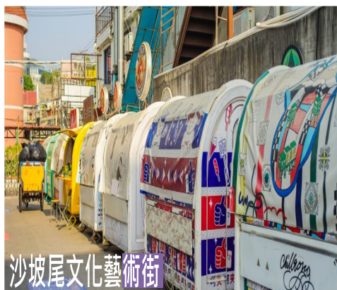
沙坡尾文化藝術街