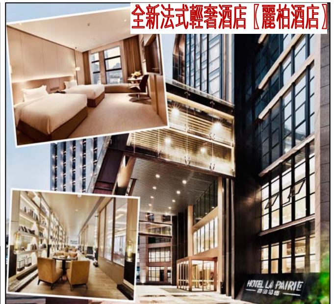
全新法式輕奢酒店【麗柏酒店】