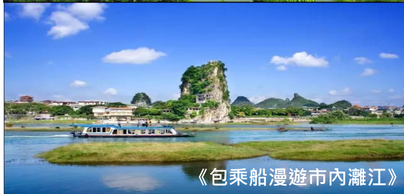
《包乘船漫遊市內灩江》

* (深圳集散團隊) * 請各團友準時集合·逾時不候·敬請注意! * 集合地點: 福田口岸(落扶手電梯·2號玻璃門外) * 集合時間待定: (出發前二天以手機短訊通知/可向分社查詢) 動車班次/時間/來回程車站(登車地點)之安排·當以鐵路公司最終安排為準·恕不另行通知。(備注: 旺季期間解散地點: 除福田關口外或有機會於羅湖或皇崗關口解散) * 此團不安排香港領隊出發