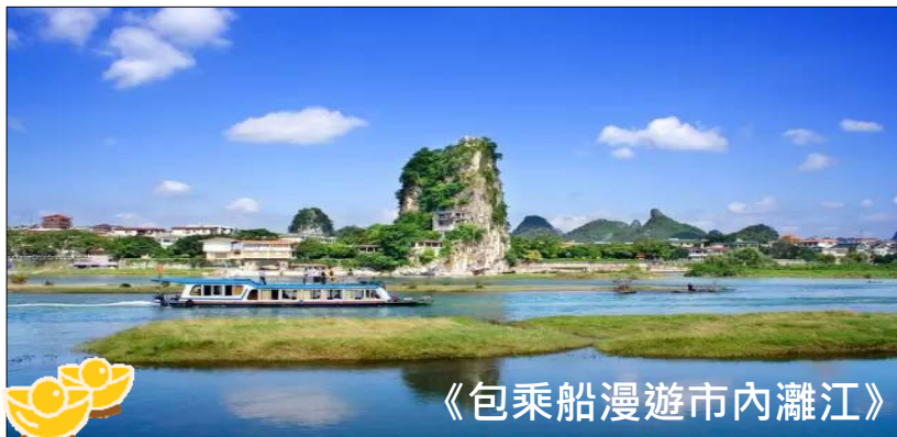
《包乘船漫遊市內灕江》