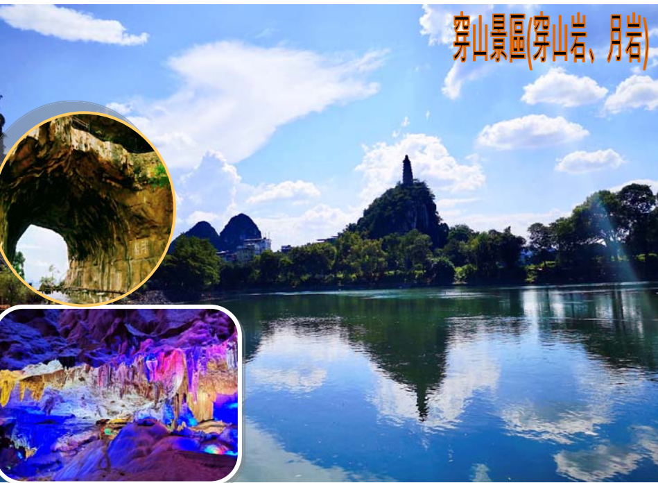
穿山景區(穿山岩、月岩)

*集合時間待定：(出發前三天以手機短訊通知/可向分社查詢)鐵路班次/時間/來回程車站(登車地點)之安排，當以鐵路公司最終安排為準，恕不另行通知。