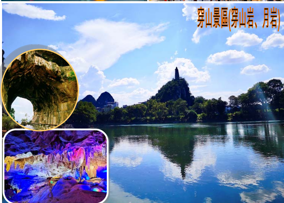
穿山景區(穿山岩、月岩)

開心增遊~訾洲公園賞鬱金香花卉 特別安排~玉鼠迎春~五彩開運餃子宴 每人一份新年小禮物桂林三寶--羅漢果