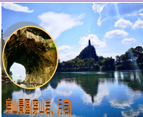
穿山景區(穿山岩、月岩)