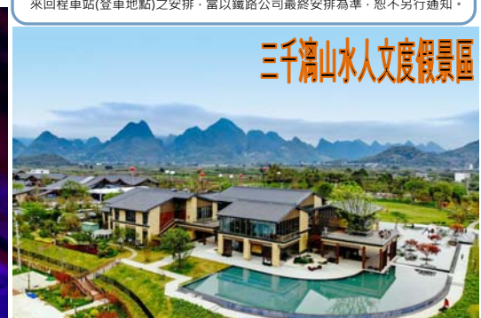
三千漓山水人文度假景區