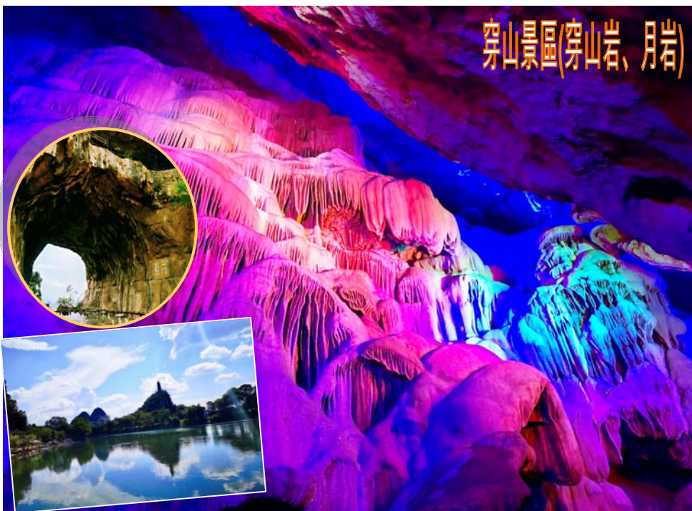
穿山景區(穿山岩、月岩)

*集合時間待定：(出發前三天以手機短訊通知/可向分社查詢)鐵路班次/時間/來回程車站(登車地點)之安排，當以鐵路公司最終安排為準，恕不另行通知。