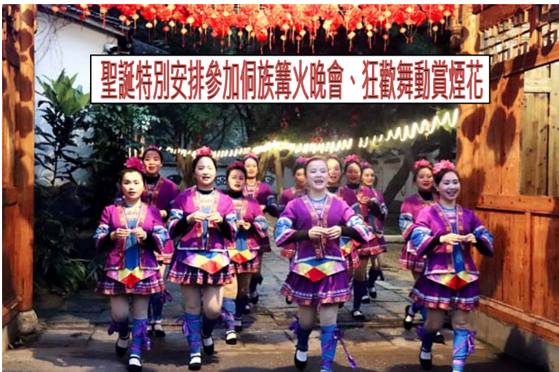
聖誕特別安排參加侗族篝火晚會、狂歡舞動賞煙花

凡報名即送 VIP 旅遊券 1 張·送完即止 (團費未包括旅遊服務費及旅遊保險)