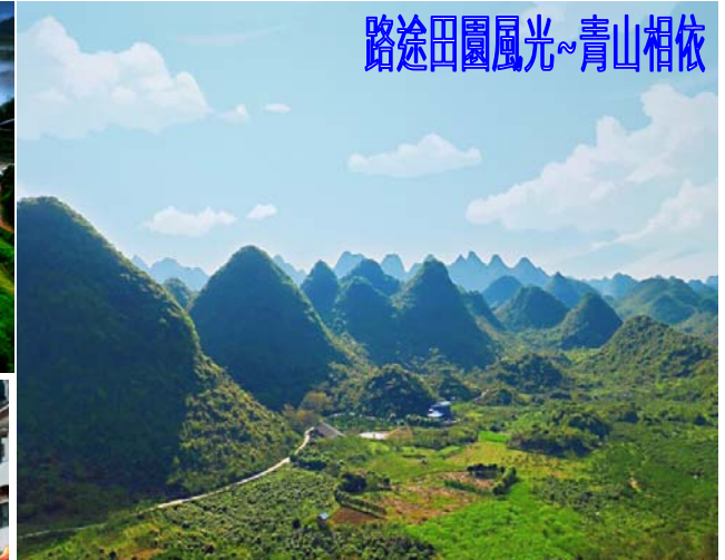
路途田園風光~青山相依