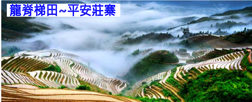
龍脊梯田~平安莊寨