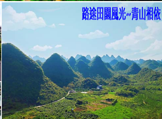
路途田園風光~青山相依