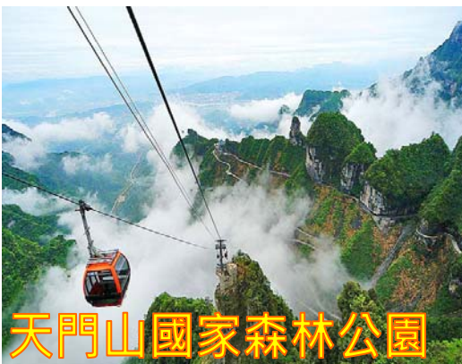
天門山國家森林公園