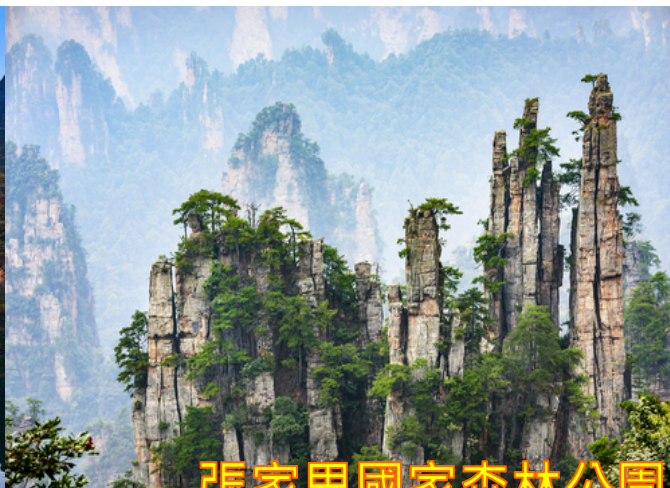
張家界國家森林公園