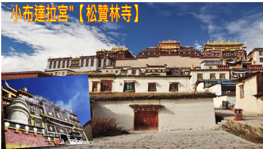
小布達拉宮"【松贊林寺】