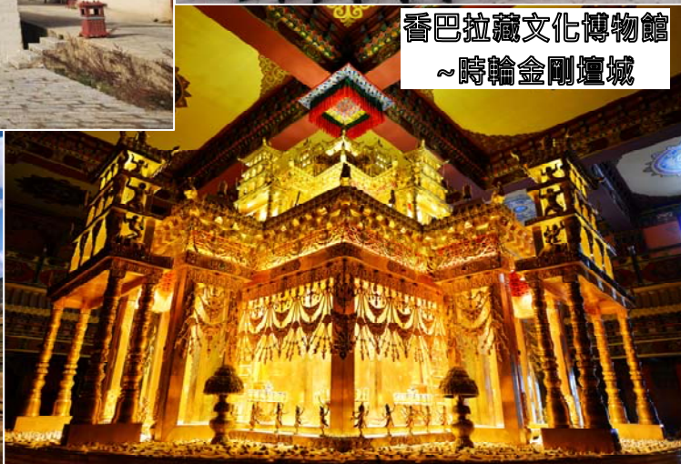
香巴拉藏文化博物館 ~時輪金剛壇城