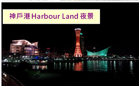
神戶港 Harbour Land 夜景