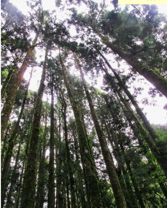
阿里山森林風景區